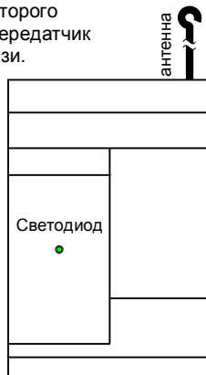
Рис. 1. Внешний вид передатчика

Каждая конкретная система RS-201 может работать в определенном частотном поддиапазоне разрешенного диапазона частот (433,92 ± 0,2%) МГц. Этот частотный поддиапазон условно называется «частотная литера».