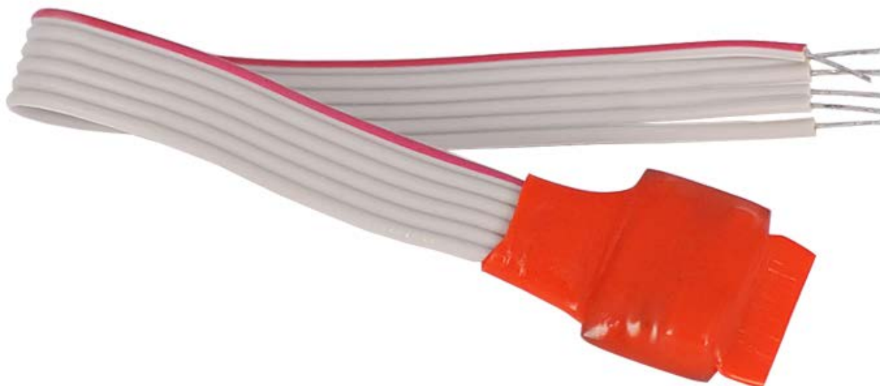
Рисунок 2.2.1 Внешний вид AP1

На рисунке 2.2.1 представлены внешний вид AP1.